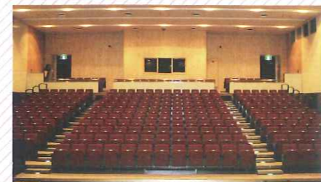
多目的ホール (293席) 移動観覧席方式なので、多目的に利用できます。