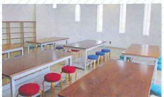
創作室 (75㎡) 美術、工芸、衣装・舞台小道具制作などに適しています。