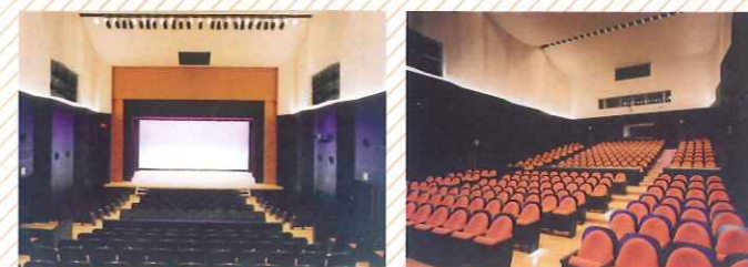
ムジカホール (293席) 車椅子スペースを備えたコンパクトなホールです。