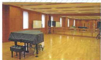
練習室1 (121㎡) 壁一面が鏡張り、ダンス等の練習に適しています。