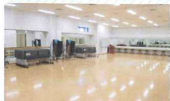
大楽屋 (196㎡) 吹奏楽など、大人数の練習にも対応できます。