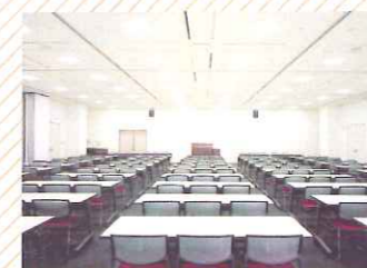
茶霧茶霧ギャラリー (289㎡) プロジェクターや音響機器を用いた本格的な勉強会にも利用できます。