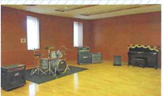
練習室2 (83㎡) 遮音性に優れており、大音量を伴う練習に適しています。