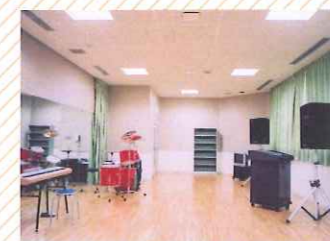
スタジオ (77㎡) 壁一面が鏡張りのスタジオです。