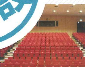
多目的研修室 (291席) 移動観覧席方式なので、多目的に利用できます。