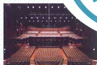
中ホール (682席) 演劇を主目的としたホールで、音響反射板も備え、音楽空間としても利用できます。