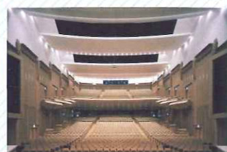
大ホール (1461席) オーケストラピット、バルコニー席を備えた音響の優れたホールです。