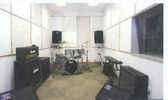
練習室3 (26㎡) ドラムセット等を備えており、バンド練習に適しています。