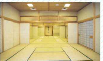
和室 (117㎡) 茶道や日本舞踊等の練習に適しています。