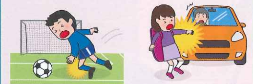
● 団体活動中のケガ ● 団体活動への往復中、車にはねられてケガをした場合

※AW・BW・CW区分にご加入の場合は、上記に加え、「団体での活動中およびその往復中」以外の事故も対象となります。ただし、熱中症、細菌性・ウイルス性食中毒を除きます。